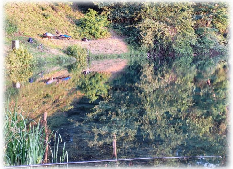
da schläft noch jemand auf der Liege