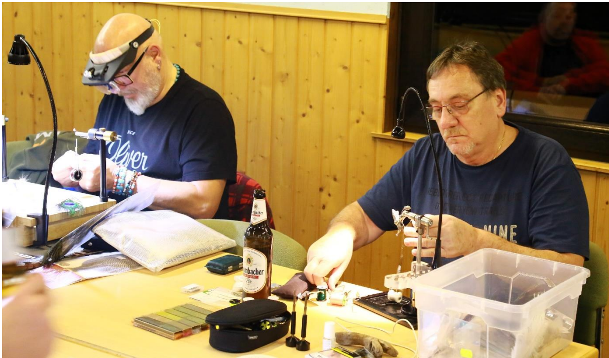
vollkonzentriert bei der Arbeit