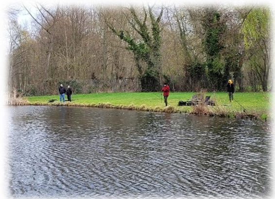
hier ist es noch trocken