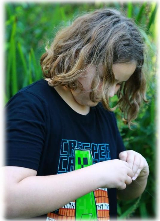
Juri ködert eine Made an den Haken