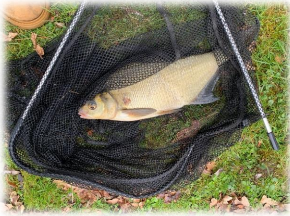
ein schöner Brassen