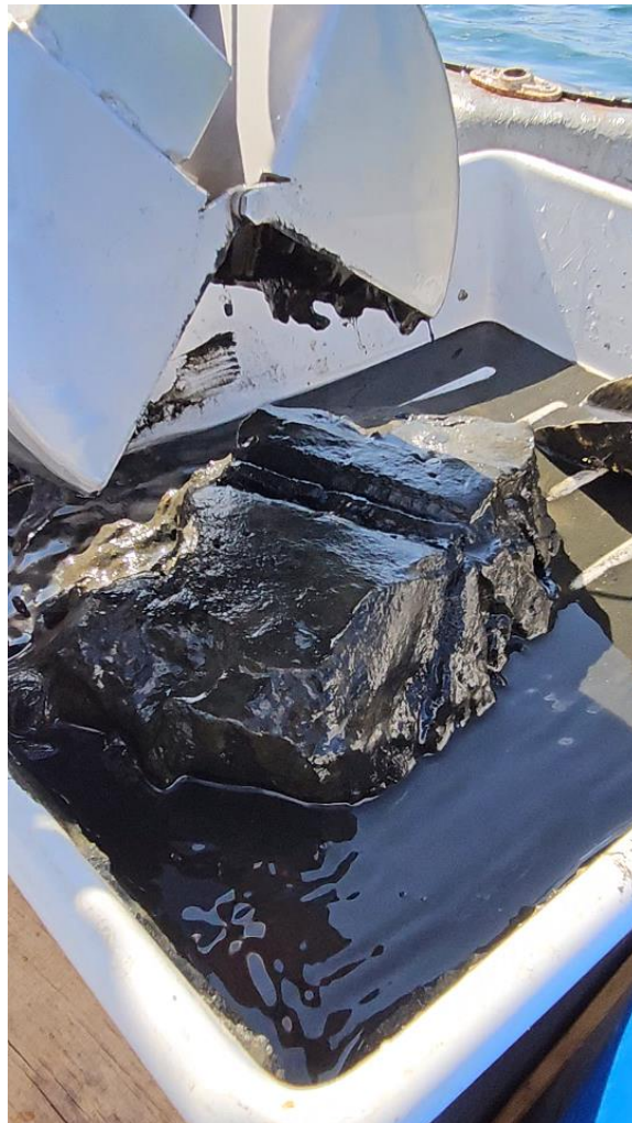
Schlammgreifer mit Sediment