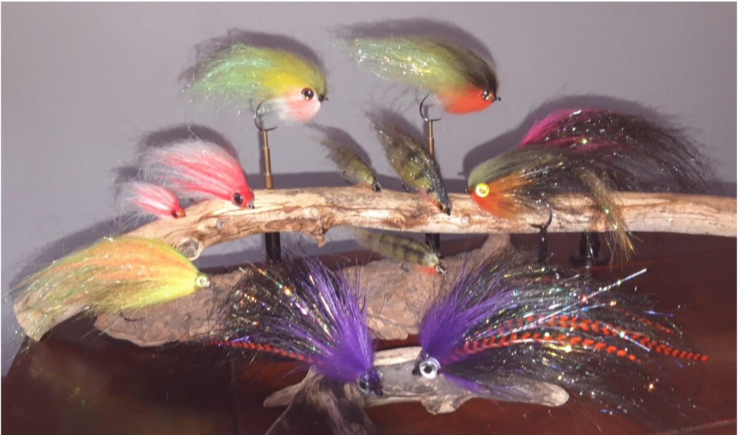
wunderschöne Bindearbeiten von Bernd Bahns