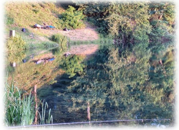
still ruht der See