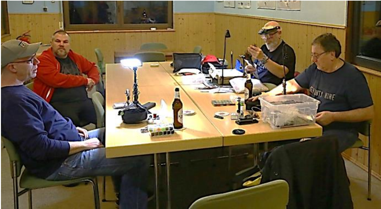
Entspanntes Gespräch in kleiner Runde