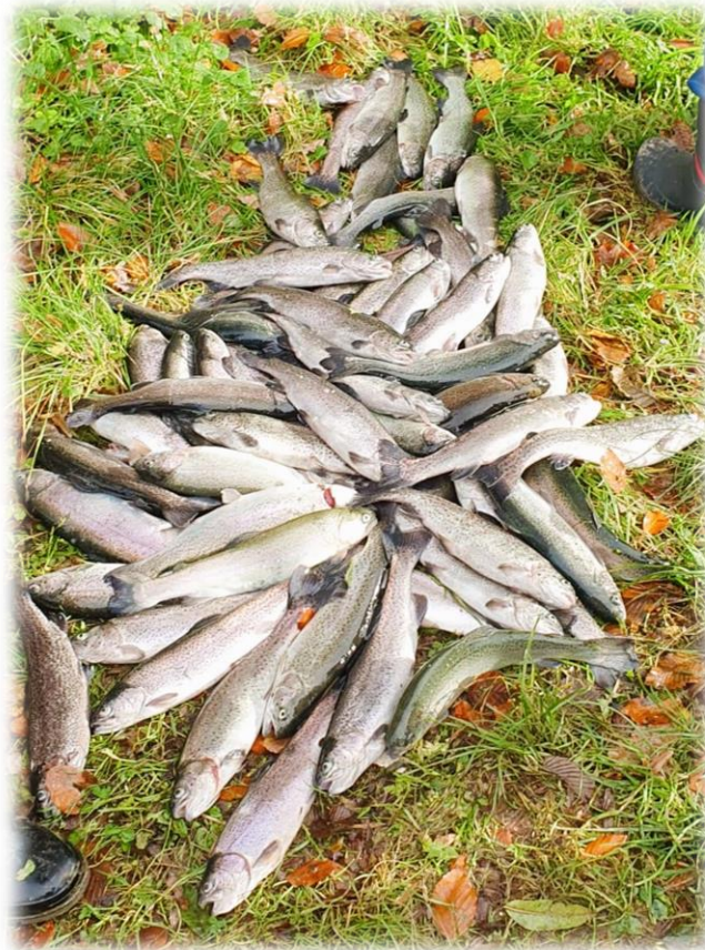
eine tolle Ausbeute der Jugendgruppe