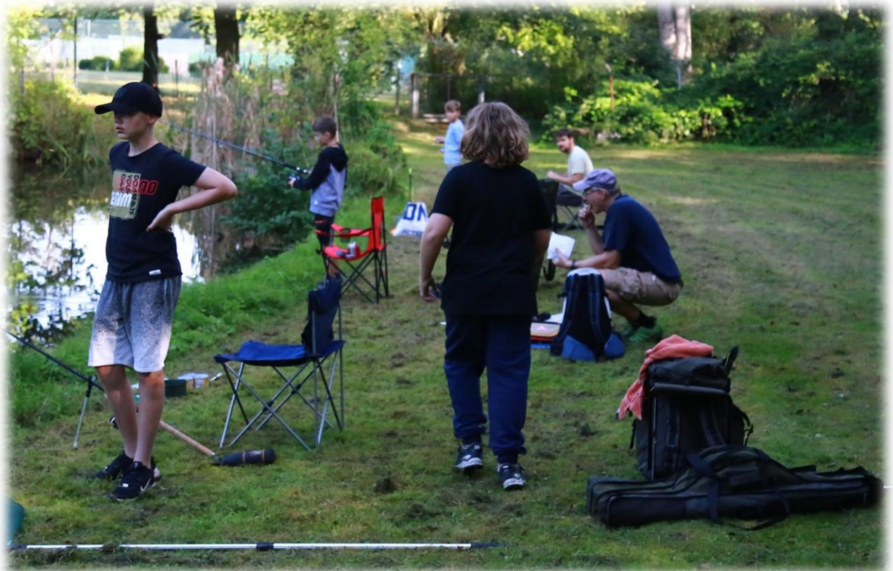
ein wenig Betrieb an der Motte